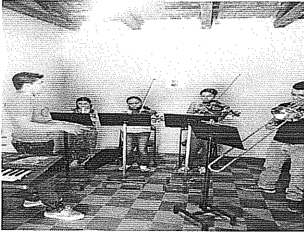
Estudio del Puntillo Actividad realizada el 17 de agosto de 2018