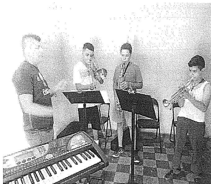
Arpeggio de La bemol mayor Actividad realizada el 6 de agosto de 2018