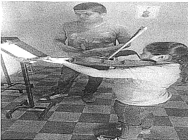
Ornamentación Actividad realizada el 24 de agosto de 2018