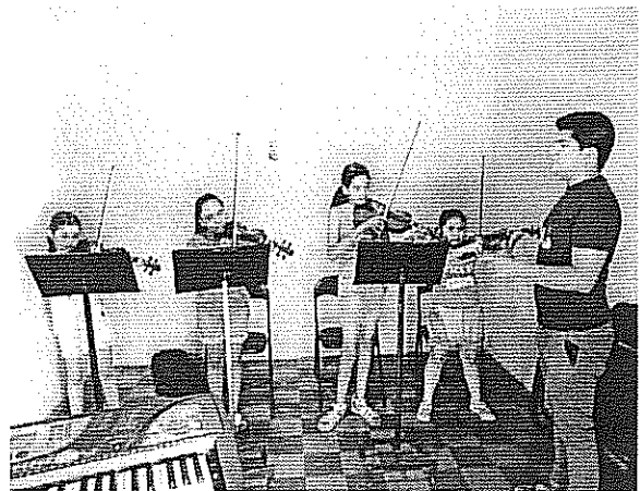
Arpeggio de Re bemol mayor Actividad realizada el 21 de agosto de 2018