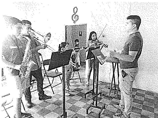
Escala de Re bemol mayor Actividad realizada el 8 de agosto de 2018