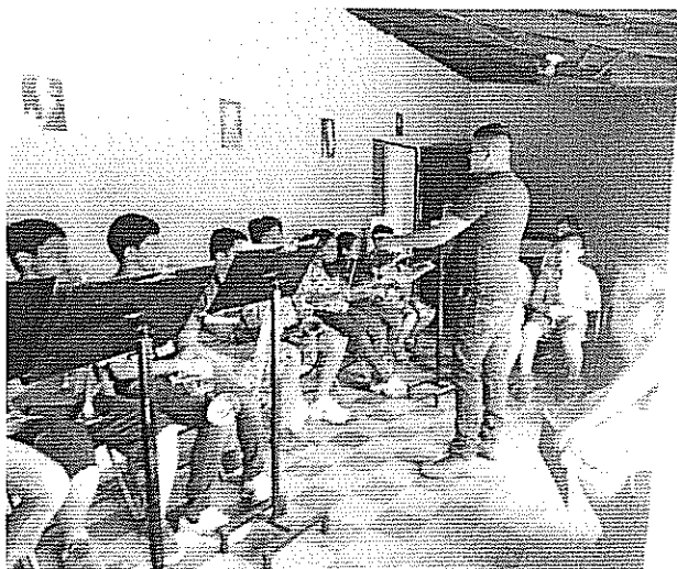
Lectura musical fase VII Actividad realizada el 2 de agosto de 2018